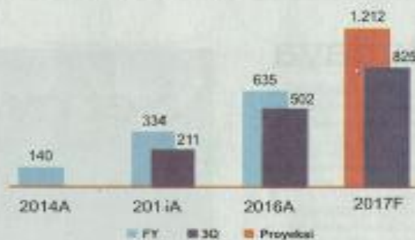
Laba Bersih (Rp Miliar)