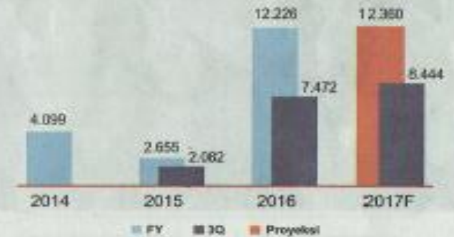
Nilai Kontrak Baru (Rp Miliar)