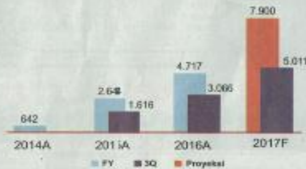
Pendapatan Usaha (Rp Miliar)