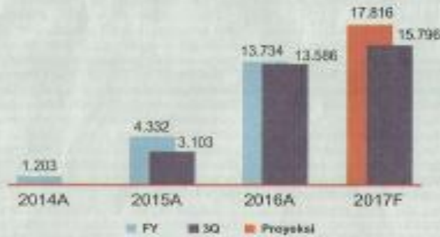
Total Aset (Rp Miliar)