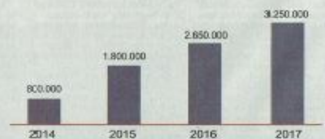
Peningkatan Kapasitas Plant (Ton per Tahun)